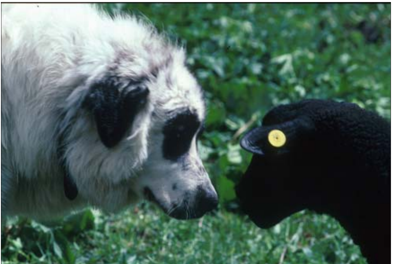
Abbildung 1: Der Hütehund Orlando schnuppert an der Nase eines Lammes