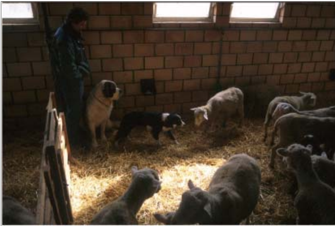
Abbildung 3: Ein Border Collie nähert sich einem Schaf, während der Bernhardiner nicht interveniert

Unglücklicherweise gibt es immer wieder Fälle, in denen ein solches Spiel für das Schaf oder das Lamm tödlich endet. Zudem gibt es auch Fälle, wo Herdenschutzhunde das Vieh des Nachbarn oder Wildtiere jagen. Ein solcher Hund ist das Resultat einer ungenügenden Auslese und er würde für die Weiterzucht nicht in Betracht kommen, da der Jagdtrieb zu stark ausgeprägt ist.