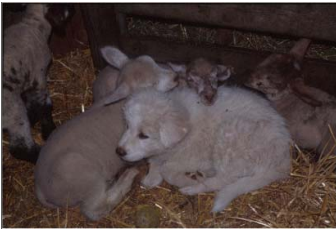
Abbildung 2: Ein 2 Monate alter Pyrenäenberghund mit Lämmern