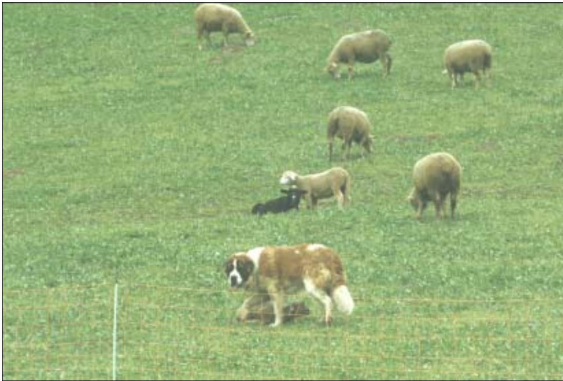
Abbildung 5: Ein Bernhardiner bewacht als Herdenschutzhund eine Schafherde im Wallis

tieres wie dem Wolf, nicht mehr angepasst. Traditionelle Hütemethoden, welche sich während Jahrhunderten bewährt haben, sind für die heutige moderne Zeit nicht mehr passend. Die Herausforderung der nächsten Jahre ist es also, Schutzmethoden zu finden und sie unserer sozioökonomischen Realität anzupassen. Es wird auch nötig sein, die Zuchtssysteme anzupassen und manchmal radikale Änderungen vorzunehmen. Dieser Herausforderung kann jedoch nur in engster Zusammenarbeit mit den Züchtern und den Hirten begegnet werden.