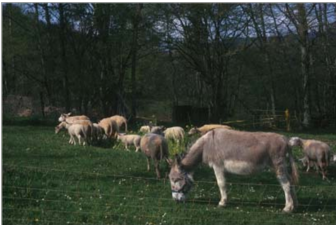
Abbildung 4: Esel in einer Schafherde

Esel sehen ausnehmend gut. Sie haben ein sehr feines Gehör, und besitzen einen äusserst feinen Geruchssinn (Ravenau & Daveze 1994). Alle drei dieser Sinne werden für das Aufdecken eines möglichen Eindringlings benutzt. Ist ein solcher da, wird geschrien, die Zähne werden gezeigt, der Eindringling wird gejagt und gebissen (Bourne 1994). Mit Ausschlagen werden Hunde und Kojoten anschliessend in die Flucht geschlagen. Das Gebrüll eines Esels kann über mehrere Kilometer gehört werden. Esel schreien, sobald es irgend ein Problem gibt. Nach der Kastration schreien die Männchen zum Teil nicht mehr (Ravenau & Daveze 1994).